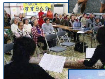
地域の方々とともに: 童謡・唱歌「うたごえ サロン」