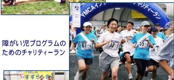
障がい児プログラムの ためのチャリティーラン