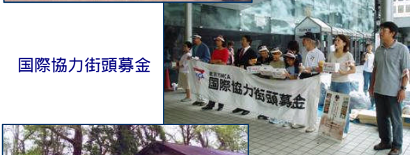
国際協力街頭募金