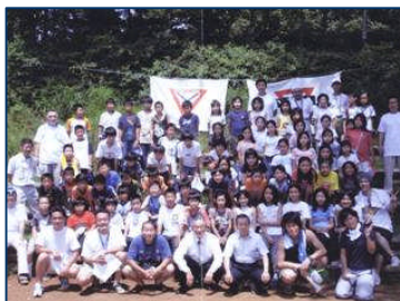
子供のための 夏季キャンプ